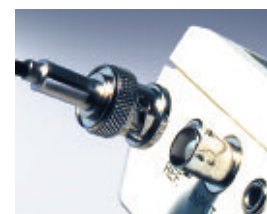
Connessione del cavo con spina BNC