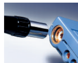
Connessione del cavo con spina DIN