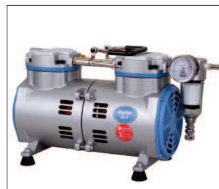
RCK 801e RCK 811