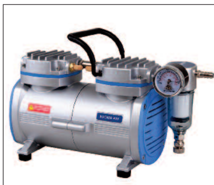
RCK 400 e RCK 410