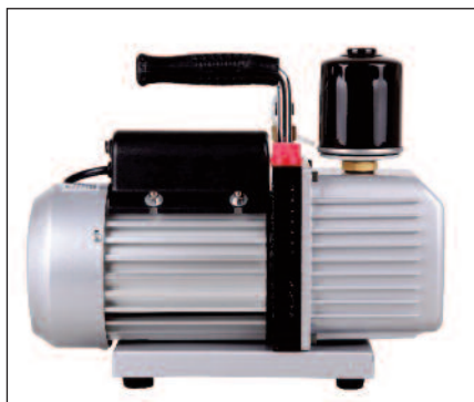
TNK con filtro