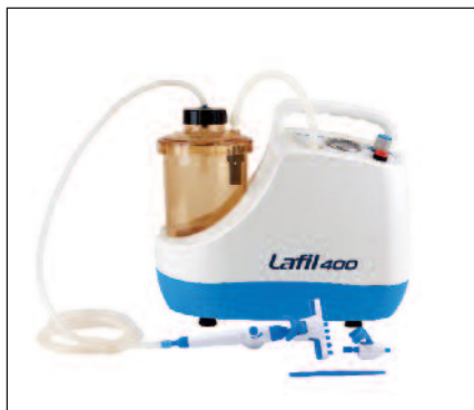
Lafil 400 Plus