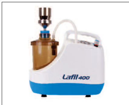
Esempio di utilizzo per filtrazioni